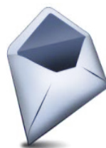
BUSTA PICCOLA DI COLORE BIANCO